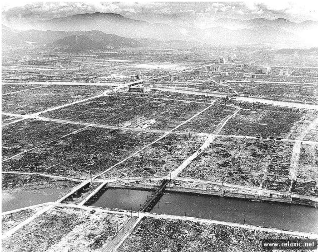
Hiroszima po ataku atomowym

Plany ataków nuklearnych na ZSRR, były doskonalone i przybierały coraz to nowe nazwy [„Pincher”, „Dropshot”, „Halfmoon/Fleetwood”, „Broiler/Frolic”, „Trojan”, „Offtacle” i inne], ale główne zadanie pozostawało bez zmian: „wyludnić terytorium Rosji, pozostawiając tam tylko szczątkowe elementy działalności człowieka” .